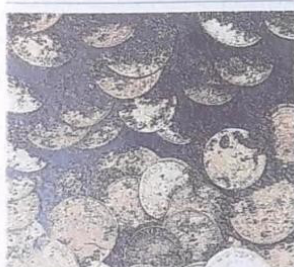
Des Louis d'or, semblables à ceux retrouvés à La Guyonnière en 1993 (photo d'illustration).